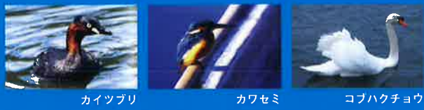
カイツブリ カワセミ コバクチョウ